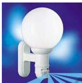
L 561 S, бяла