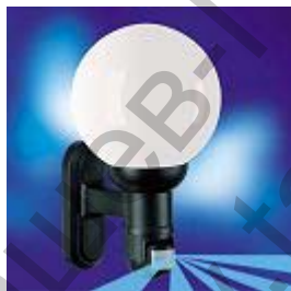
L 561 S, черна