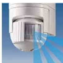
Намаляване на ъгъла на покритие