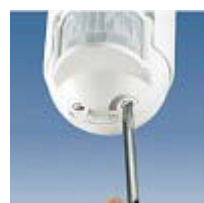
Нагласяне на времето