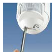
Нагласяне на интензитета