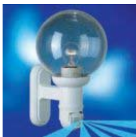
L 560 S, бяла