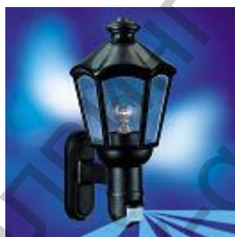
L 562 S, черна