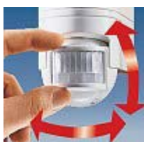
Завъртане на сензора