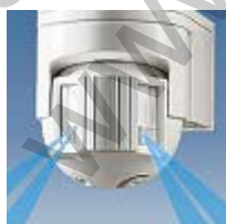
Намаляване на ъгъла на покритие