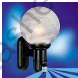
L 563 S, черна